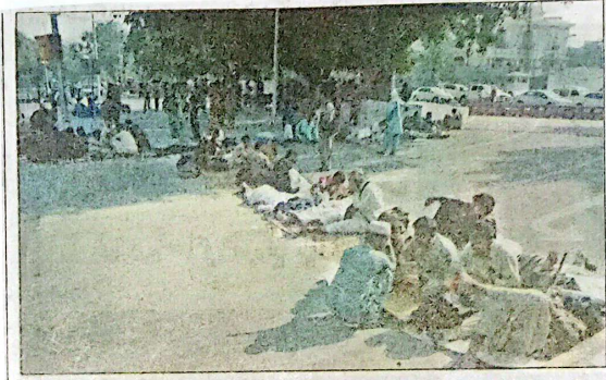
لاہور: تائبہ افراد کا مطالبات کے حق میں مال روڈ پر دھرنا جاری ہے