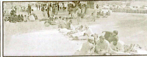
لاہور: تاجینا افراد نے اپنے مطالعات کسٹن میں ماں روڈ

چیزنگ کر رہی ہیں۔ میں رونا سے کھاتے تاش کھیلے آرام کرتے ہوئے۔